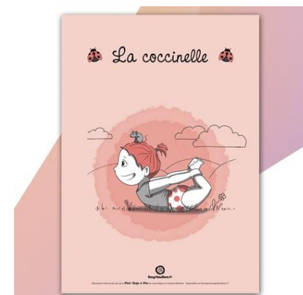
Mathilde en posture « coccinelle » Future prof de yoga pour enfants ? ;-)

Au départ, les enfants étaient plutôt dans l'observation, mais ils ont rapidement été participatifs en se mettant en mouvement, probablement rassurés par l'individualisation qui leur était apportée. Pari réussi !